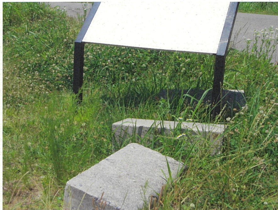
コンクリートをはねのけている部分