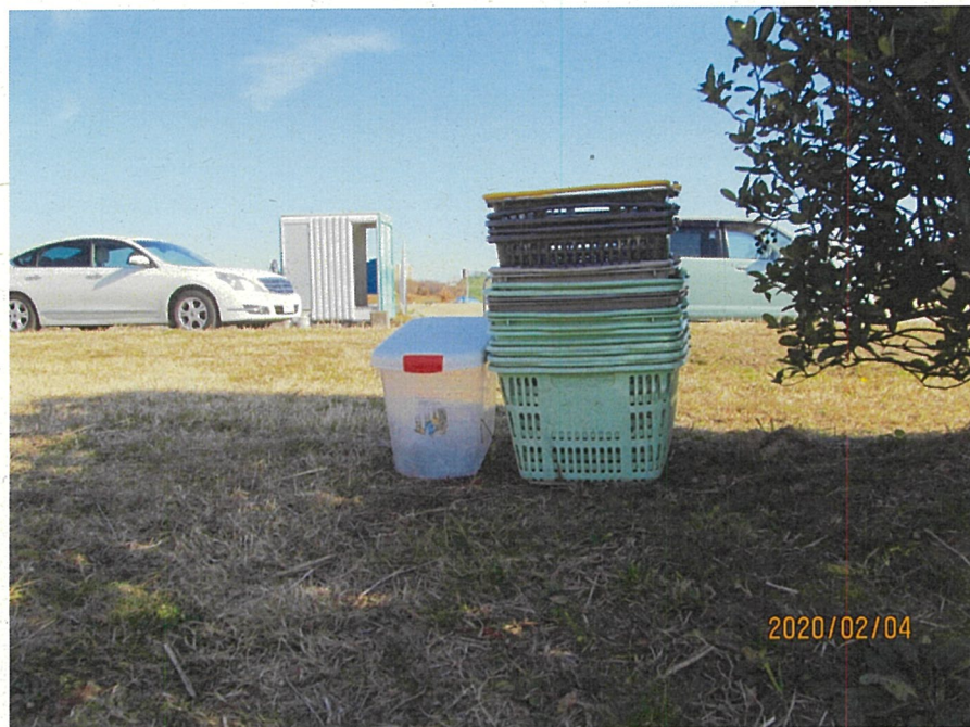
大量の買い物かご