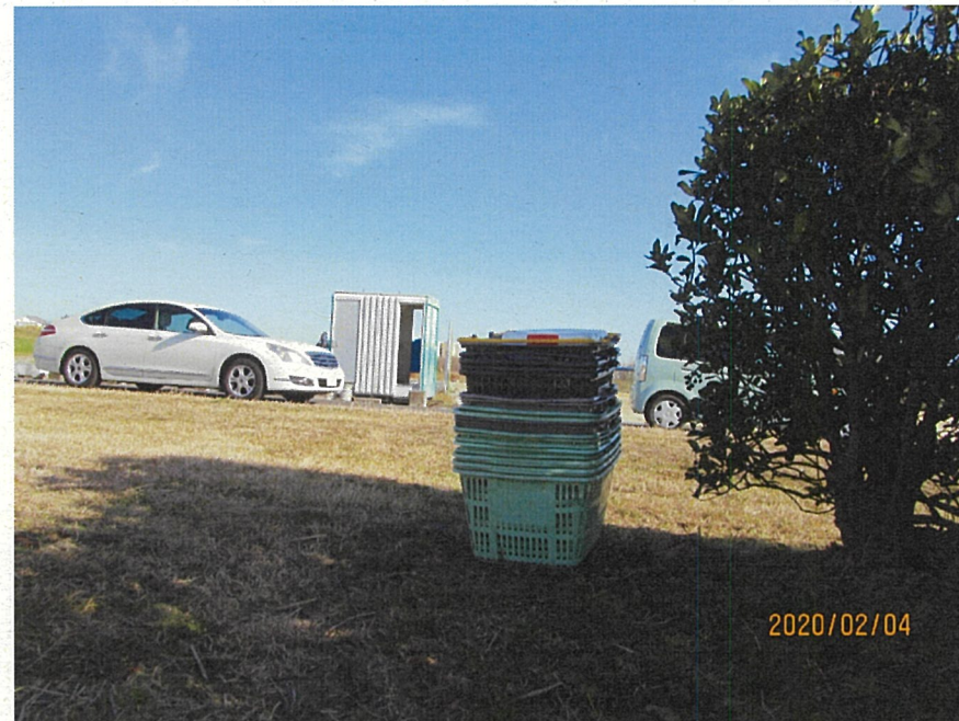
大量の買い物かご