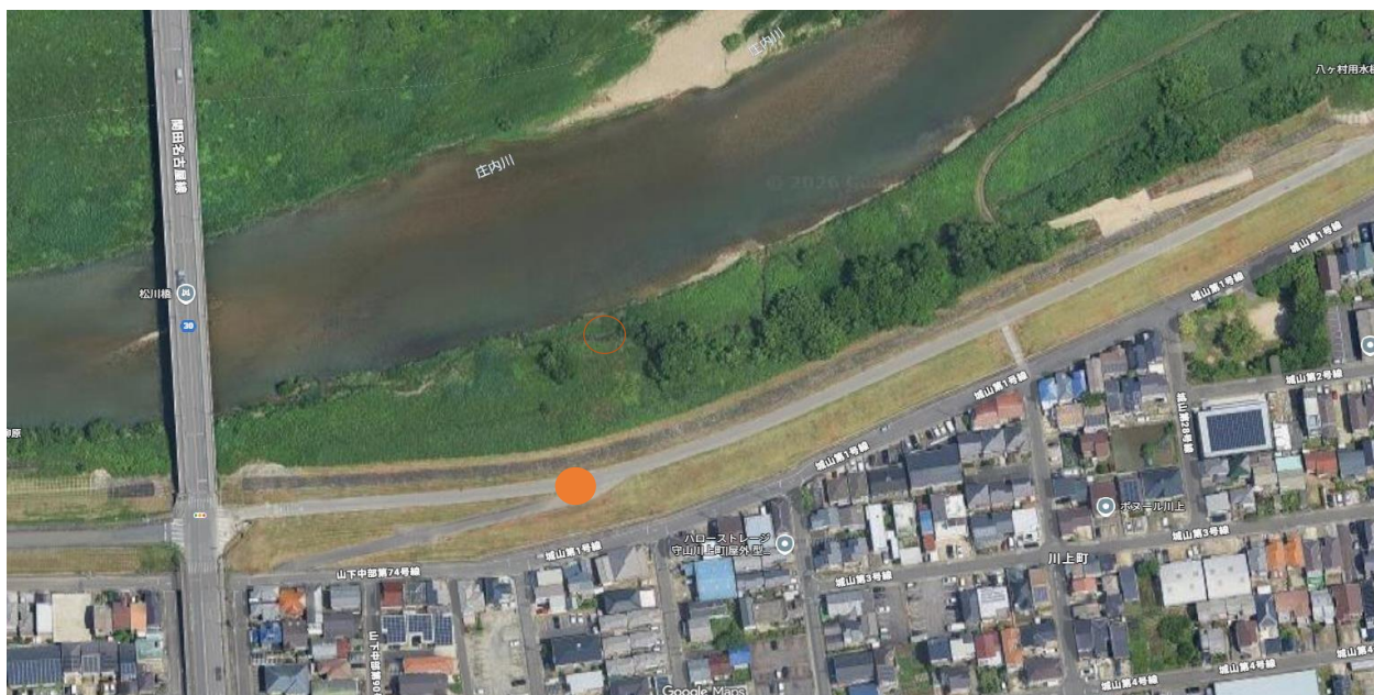
ごみの集積位置図