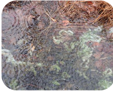
湿地にカエルの卵