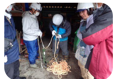
安全ベルトの使い方