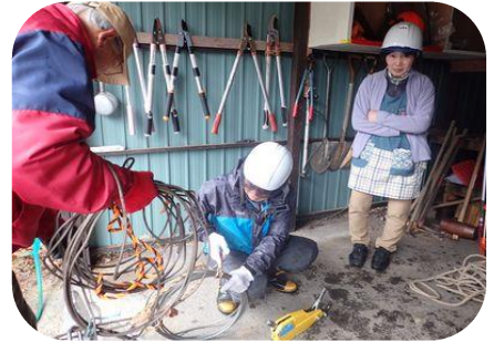
チルホールの使い方