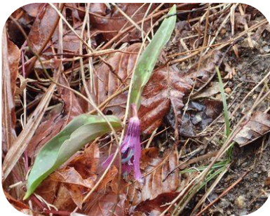
広場にカタクリ花一輪