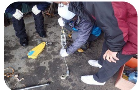
ウィンチの使い方