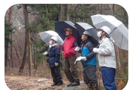
馬頭山林の来季作業