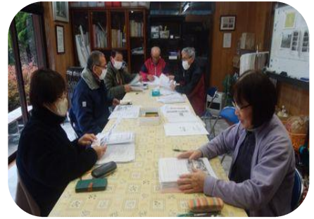
本日の打ち合わせ