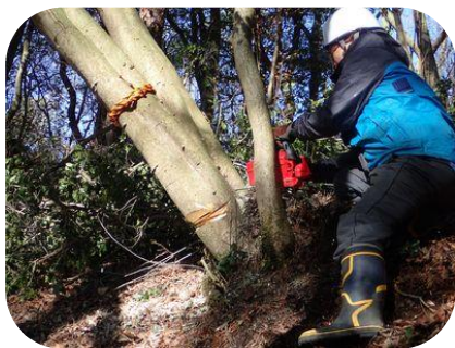
馬頭山林：事前の伐倒処理 2/16