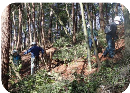
馬頭尾根筋の手入れ