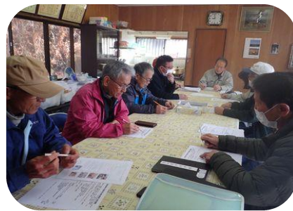
本日の作業の打ち合わせ