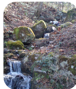
原石山手入れ後の景観