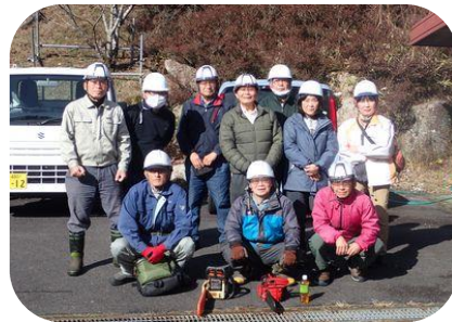
これから現場へ出発