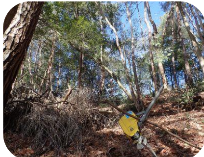
チルホールで方向決めて 2/16