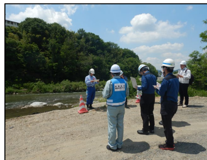
土岐川50.2k付近を巡視