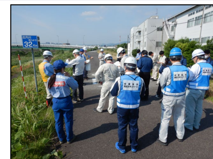
庄内川32.0k付近を巡視