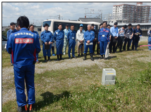
出発式の様子（庄内川右岸14.2k付近）