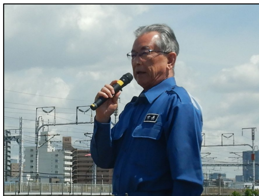
清須市長による挨拶