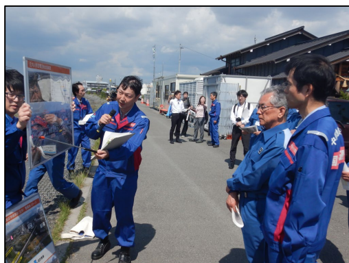
庄内川特定構造物改築事業の説明を実施