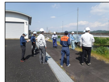
土岐防災センター付近を巡視