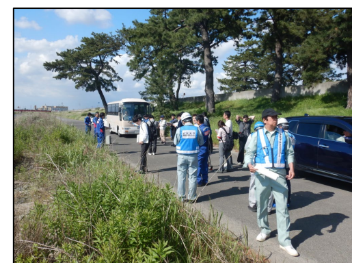
庄内川左岸5.0kの説明を実施