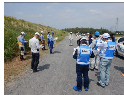
庄内川28.5k付近を巡視