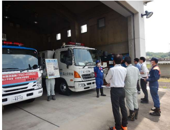
土岐防災センターの説明