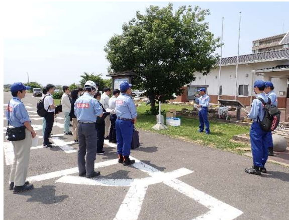
巡視出発前の説明