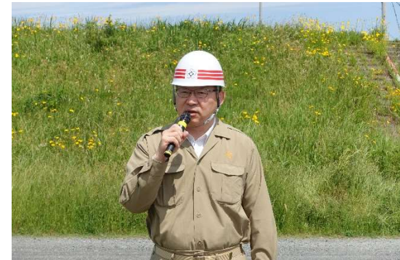
春日井市長による挨拶