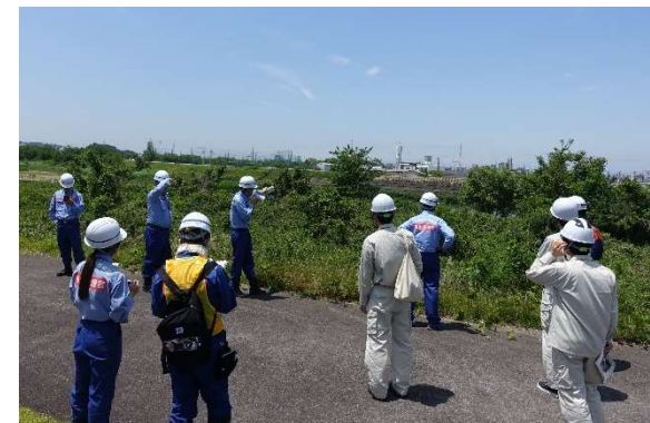
庄内川第二出張所長が巡視のポイントを解説