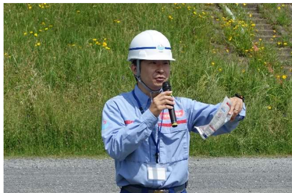
奥中事務所長が水防活動の効果などを紹介