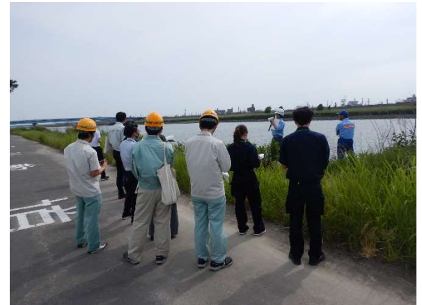
庄内川下流部での巡視