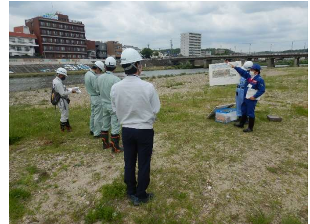
多治見市区間での巡視