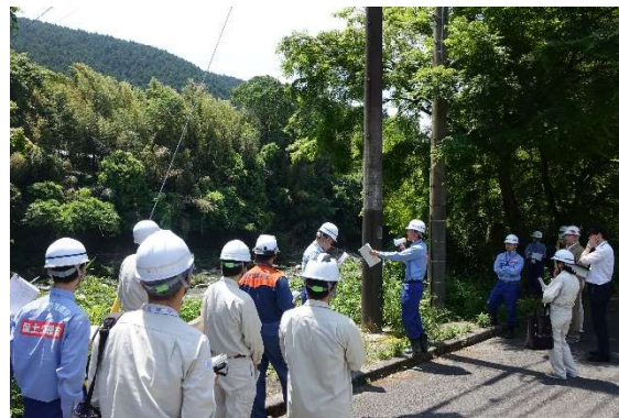
越水が懸念される箇所の巡視の様子