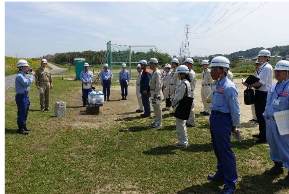
出発式の様子（上条グラウンド）