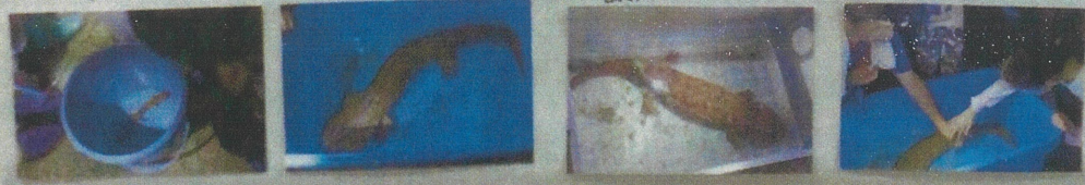
うがいは目の大きさ、鱗、体の色