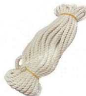
17 ロープ 7m