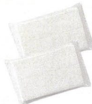
15 ポケットティッシュ 2個