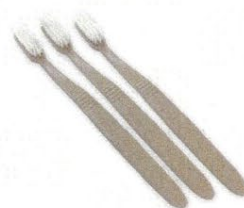
20 歯ブラシ 3個