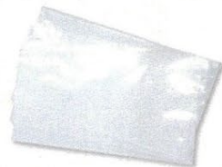
16 ポリ袋 3枚