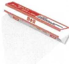
13 ラップ 2m