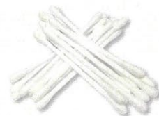
18 綿棒 20本