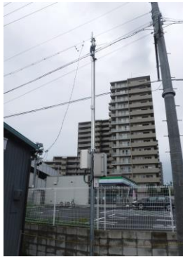
河川カメラの設置状況