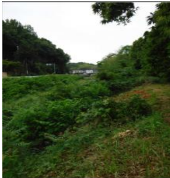
河畔林の繁茂状況