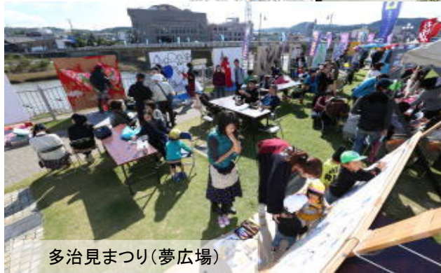
多治見まつり(夢広場)