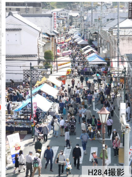
たじみ陶器まつり (本町オリベストリート)