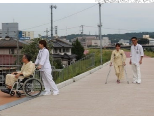
多治見市民病院と繋がるブリッジの利用状況 H26.9撮影