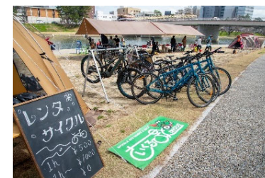
写真おとがワ！ンダーランドHP