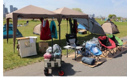
マルシェ（アウトドア用品）