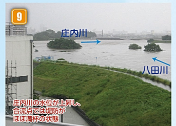
庄内川の水位が上昇し、合流点では堤防がほぼ満杯の状態