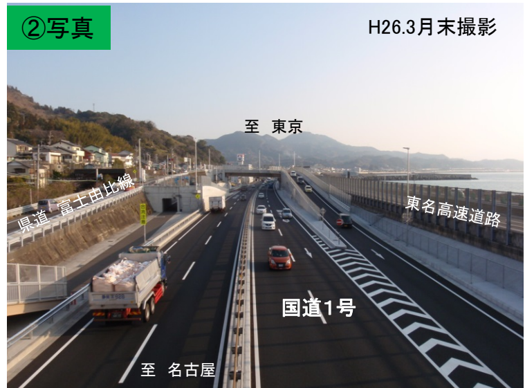
名古屋方面から東京方面を望む