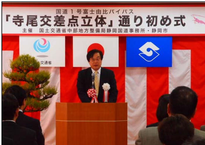
事業者挨拶（中部地方整備局長）