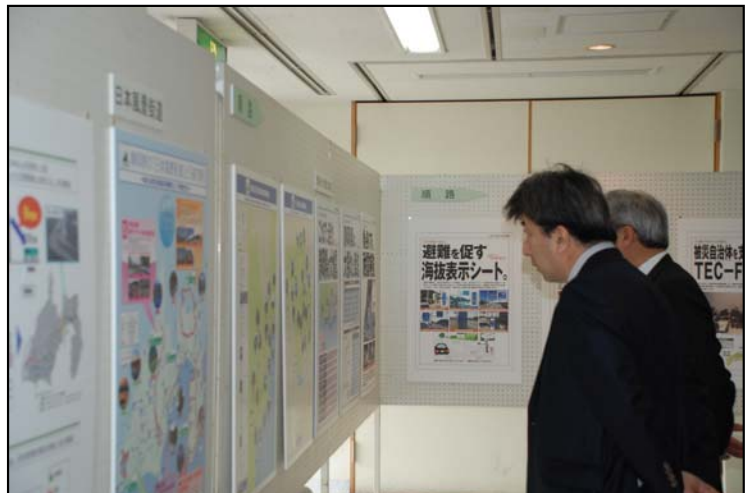
交流館ロビーにて日本風景街道等のパネルを展示