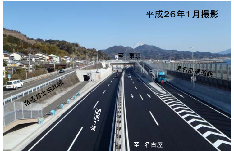
平成26年1月26日（日）22:00 下り線（名古屋方面）合流ランプ開通

開催日時：平成26年1月26日（日） 10時30分～11時 式典会場：静岡市由比生涯学習交流館 主催：国土交通省・静岡市 次第：式辞（静岡市長） ：事業者挨拶（中部整備局長） ：祝辞（国会議員、市議会副議長） ：来賓紹介 ：事業説明（静岡国道事務所長） 参加：55名