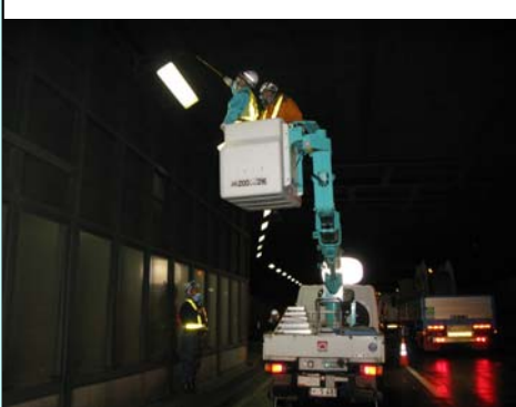
天井板の点検状況。

吊り金具や固定金具について、近接目視・打音・触診により破損・変形の有無及び落下に繋がる可能性のある事象の有無を調査しましたが、特に異常はみられませんでした。