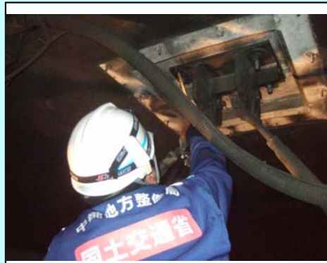
天井に設置されているジェットファンの取付状況の確認。