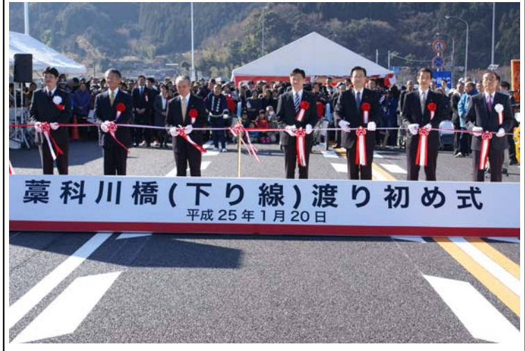
〈式典テープカットの様子〉