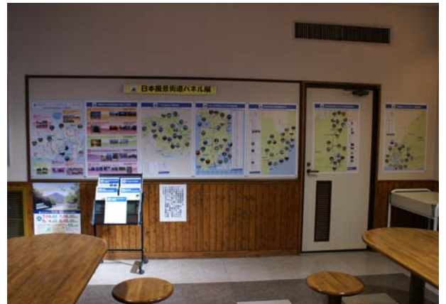
道の駅「宇津ノ谷峠」