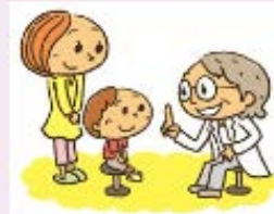
(イラスト：政府広報オンライン)

武漢市から帰国・入国される方におかれましては、咳や発熱等の症状がある場合や解熱剤などの薬剤を使用している場合には、検疫所で必ず申し出てください。また、国内で症状が現れた場合は、マスクを着用するなどし、あらかじめ医療機関に連絡の上速やかに医療機関を受診していただきますよう、御協力をお願いします。なお、受診に当たっては、武漢市の滞在歴があることを申告してください。