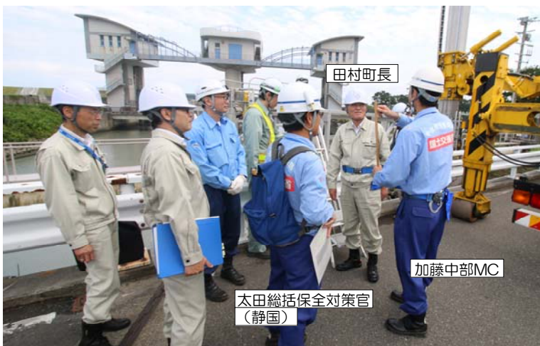
点検状況（概要）を説明中