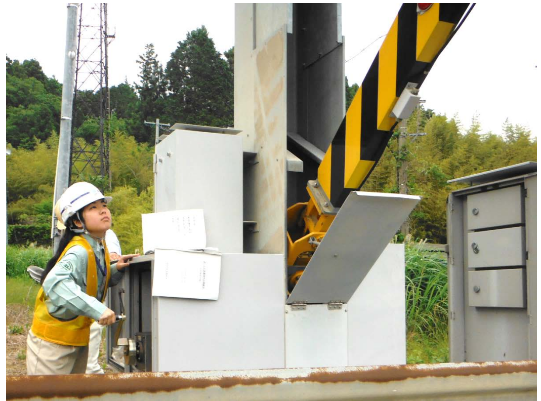
停電が発生し電動で操作できないことも想定して、手動で遮断機を操作