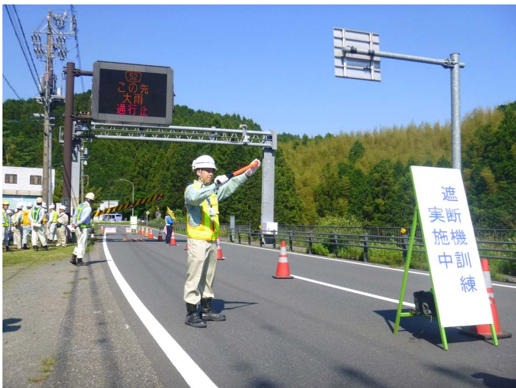
道路情報板により、道路利用者に通行規制を周知