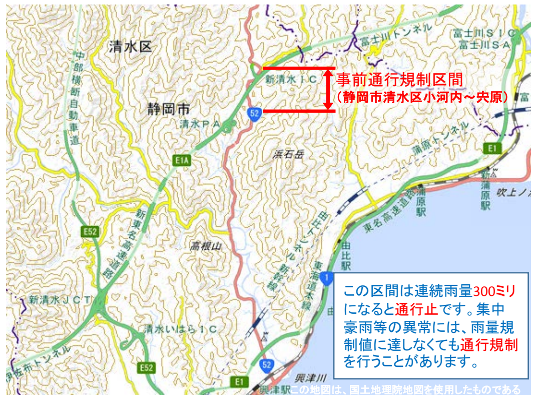
国道52号の大雨時の事前通行規制区間

この区間は連続雨量300ミリになると通行止です。集中豪雨等の異常には、雨量規制値に達しなくても通行規制を行うことがあります。