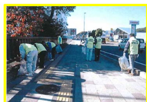
国道1号における活動の様子