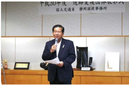
富士宮市長より激励の言葉