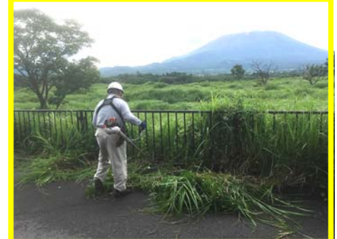
国道139号における活動の様子