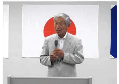
磯谷会長より受贈者の言葉