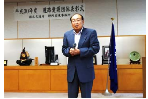
中込会長より受贈者の言葉