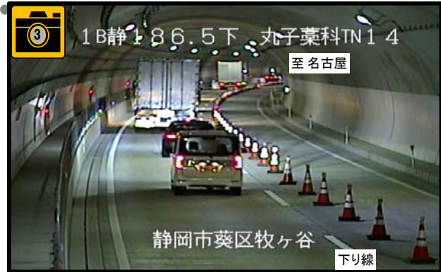
トンネル内の通行状況