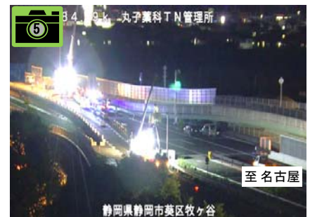
夜間施工状況 H30年7月 19日22時