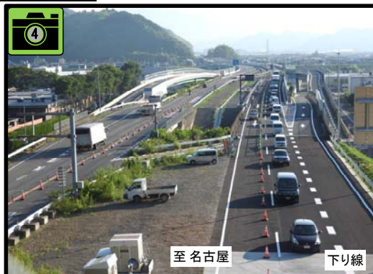
切替え後の通行状況 H30年7月 20日6時