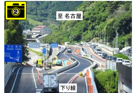
切替え後の通行状況 H30年7月 21日8時