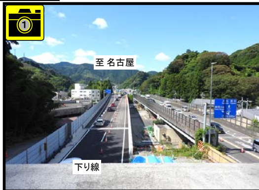
切替え後の通行状況 H30年7月 21日9時