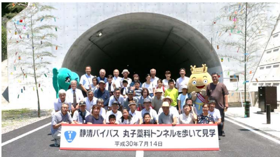
参加者で記念撮影(丸子藁科トンネル西坑口)