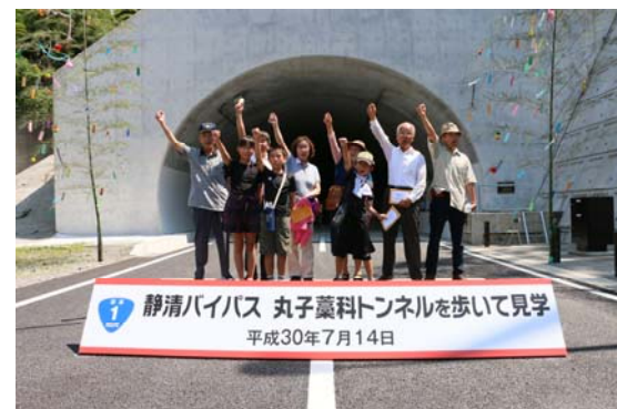
スタンプラリースタート