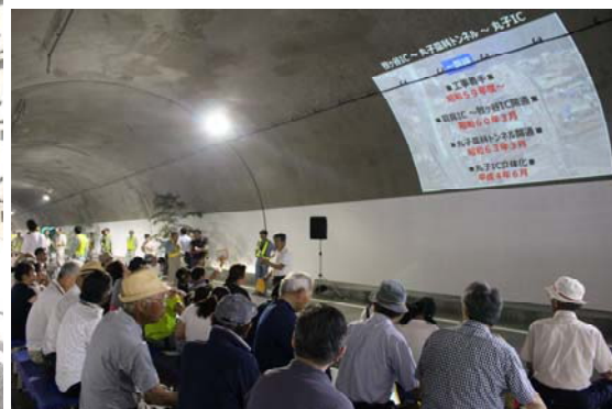
静清バイパスの歴史を学ぶ (スタンプラリー最終地点)