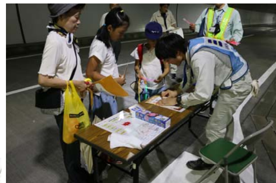
チェックポイントでスタンプ押印