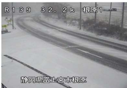
富士宮市根原 1月22日13時