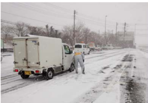
朝霧さわやかパーキング