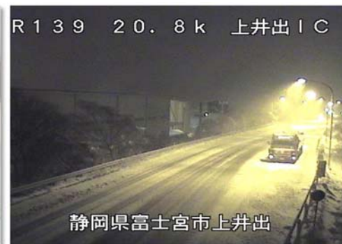
富士宮市上井出 1月22日20時