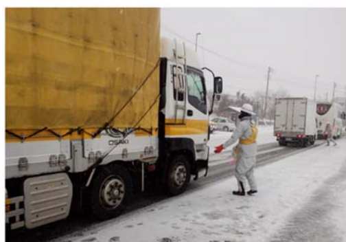
朝霧さわやかパーキング