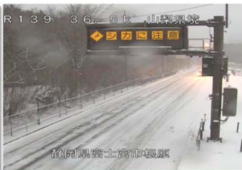
富士宮市根原（県境付近） 1月22日17時