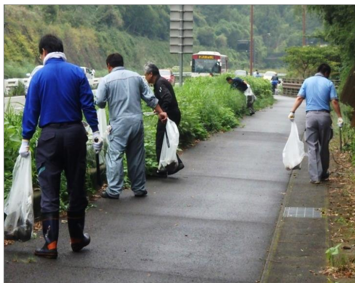
県トラック協会中央地区支部 中部分室の活動の様子 (10/13)