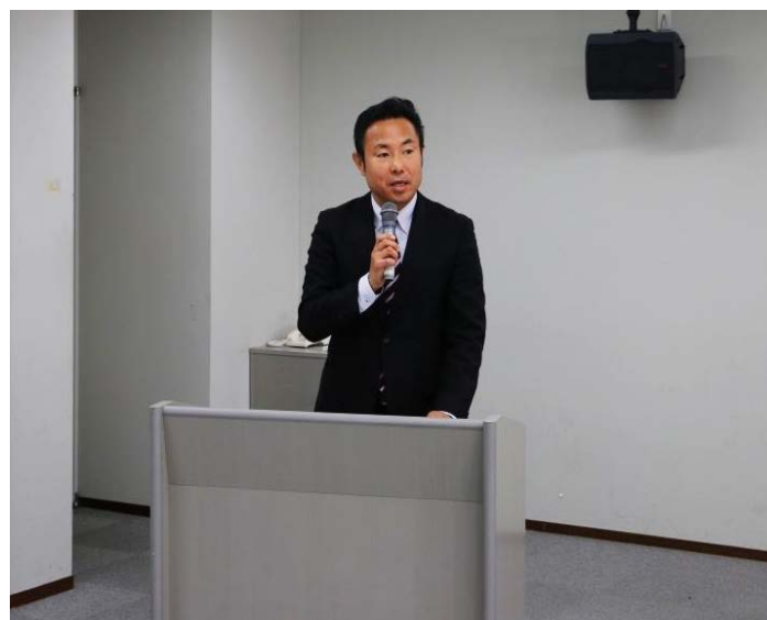
隅蔵所長による挨拶