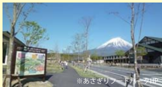
あさぎりフードパーク

道の駅は、休息・情報交流・地域連携という3つの機能を併せ持つ休息施設です。施設内には、レストラン、土産物売店、アイスクリーム工房、売店には新鮮野菜売場を併設しています。 【営業時間】売店・アイス工房:8:00~18:00 食堂(レストラン):8:00~17:30