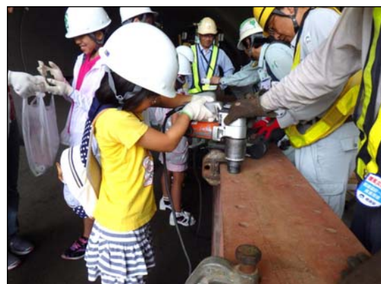
ボルトの締め付けを体験