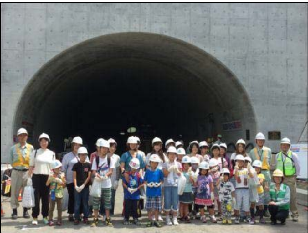
丸子藁科トンネルの前で記念撮影