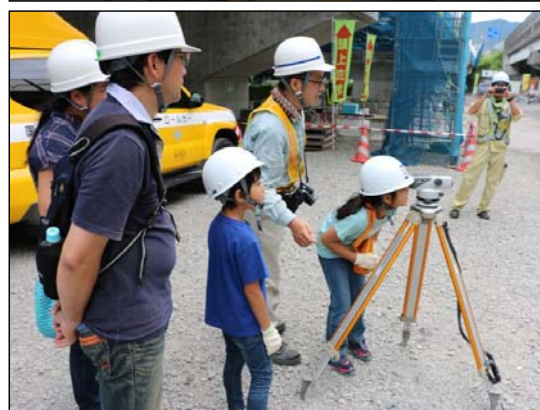
ボルトの締め付けや測量を体験