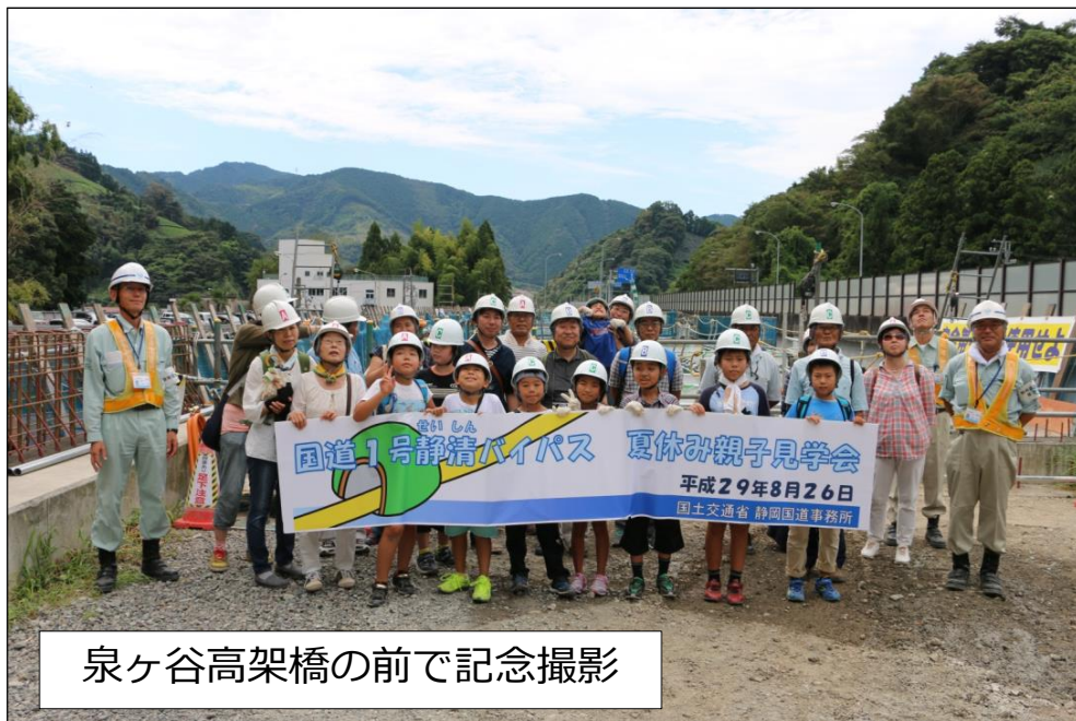
泉ヶ谷高架橋の前で記念撮影