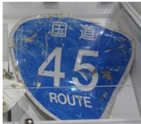
損傷した道路標識