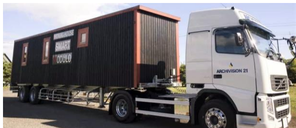
移動可能なコンテナ型ムービングハウス