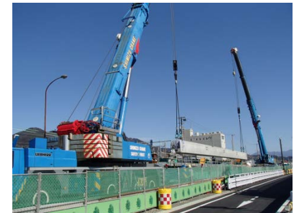
下り線の架設状況