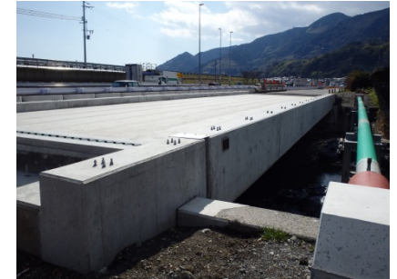
上り線の架設完了