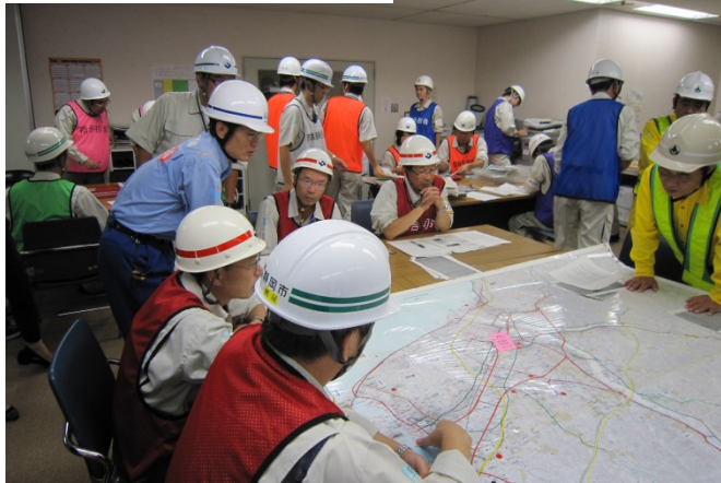
関係機関による協議