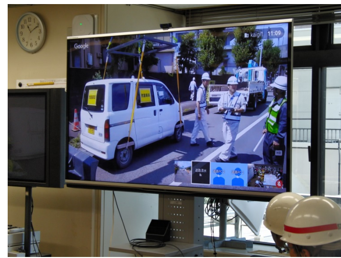
道路啓開実施状況の映像を確認