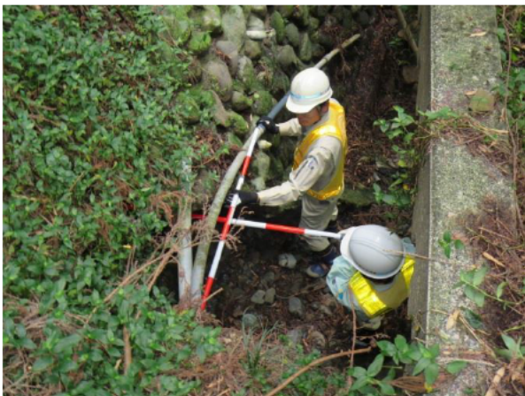
道路横断水路の状況確認