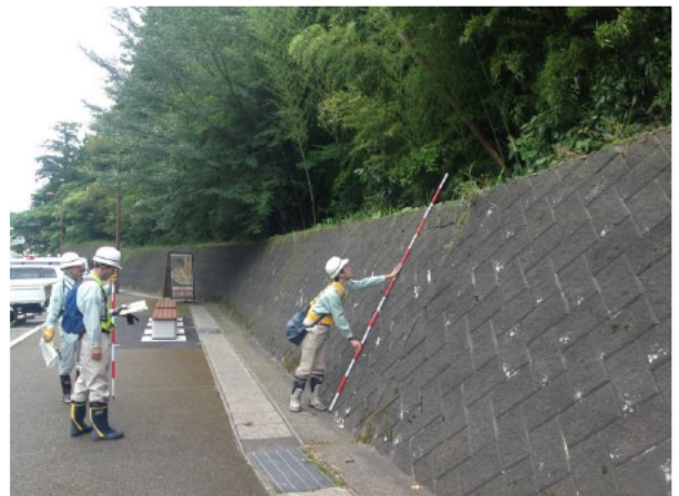
点検箇所の変化を確認している状況