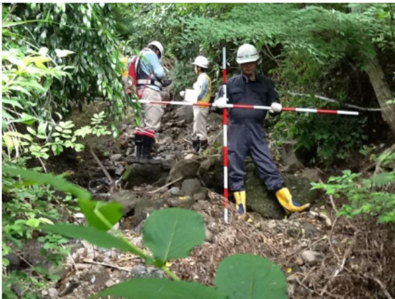
土石流箇所の状況確認