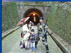
⑦ 宇津ノ谷峠(明治トンネル前)