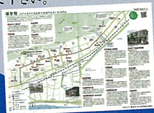
散策マップは8箇所10種類あります。