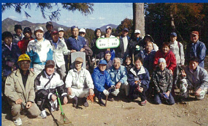
メンテナンス作業で集まったメンバー