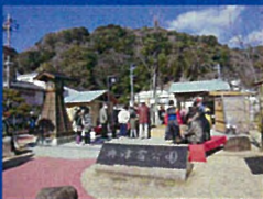
③ 寒ざくらまつり(興津)(2月)