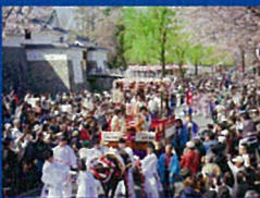
⑤ 静岡まつり(府中)(4月)