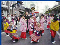
② 丸子宿場まつり(2月)