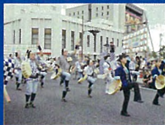
④ 清水みなと祭り(江尻)(8月)