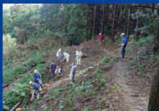
眺望阻害の伐採状況