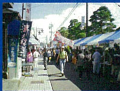
⑥ 由比街道まつり(由比)(10月)