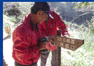
案内板の設置活動の様子