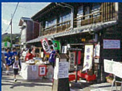
① 蒲原宿場まつり(11月)