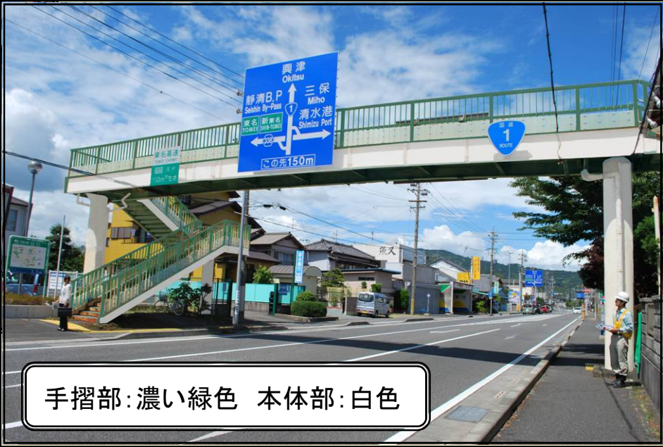
手摺部：濃い緑色 本体部：白色

周辺環境：旧東海道の面影を残しており、沿道には銀行やレストラン等が立ち並ぶ。 色彩コンセプト：歩道橋のフォルムを活かし周辺環境に調和した配色デザインとする。