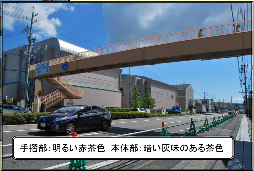
手摺部：明るい赤茶色 本体部：暗い灰味のある茶色

周辺環境：趣のある外観の銀行や学校が立ち並ぶ。 色彩コンセプト：落ち着いた、格調高さ、親近感がイメージできる配色デザインとする。