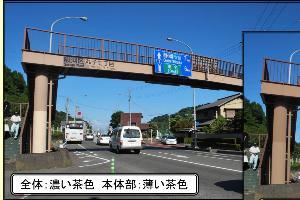
全体：濃い茶色 本体部：薄い茶色