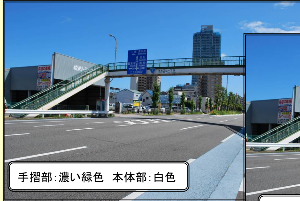
手摺部:濃い緑色 本体部:白色