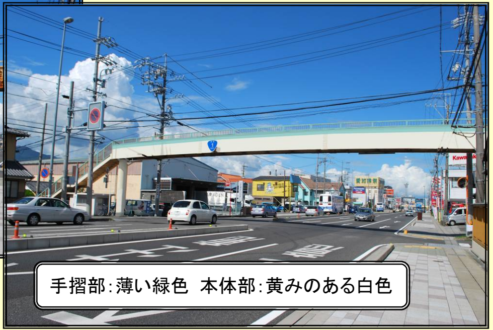
手摺部: 薄い緑色 本体部: 黄みのある白色

周辺環境: 様々な店舗や看板、電柱が立ち並んでいる。 色彩コンセプト: さわやかさと親しみがイメージでき、 周辺環境から突出しない配色デザインとする。