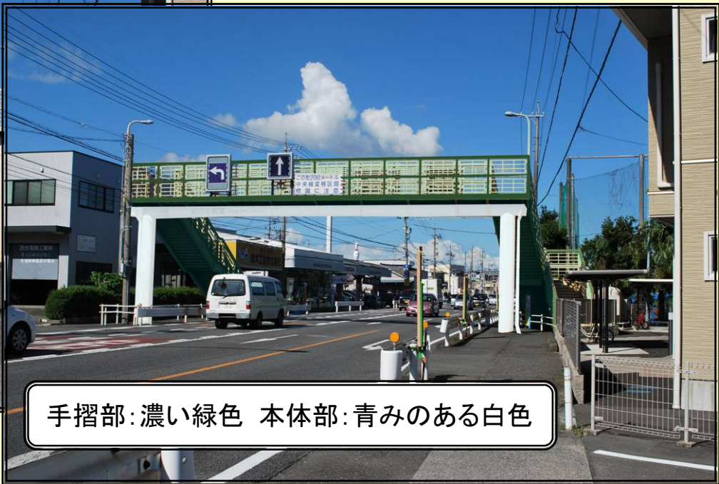
手摺部:濃い緑色 本体部:青みのある白色

周辺環境:横断歩道橋に近接して中学校があり、登下校の利用がある。 色彩コンセプト:環境への優しさ、清潔感をイメージした配色デザインとする。