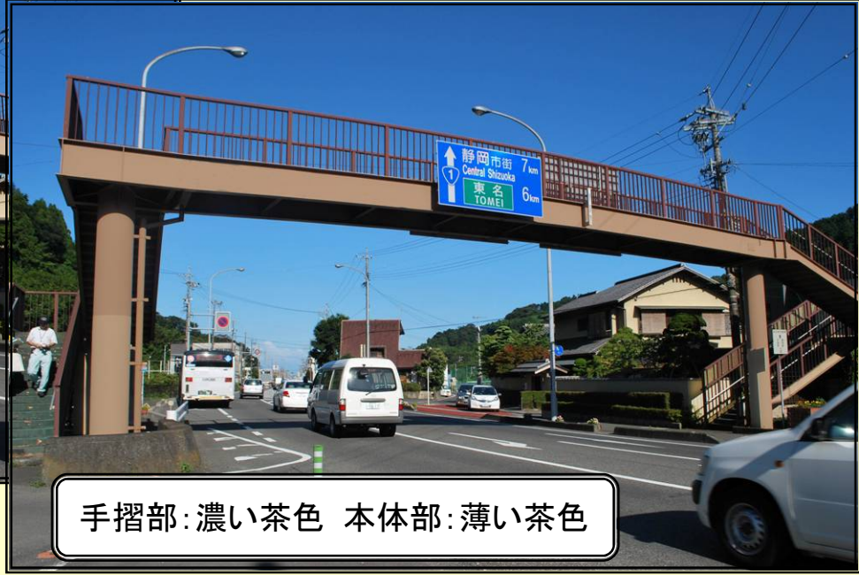
手摺部：濃い茶色 本体部：薄い茶色

周辺環境：東海道の歴史や文化の趣を感じさせる沿道環境である。 色彩コンセプト：現況の茶色の配色は、沿道環境と調和していることから 現況を踏襲した配色デザインとする。