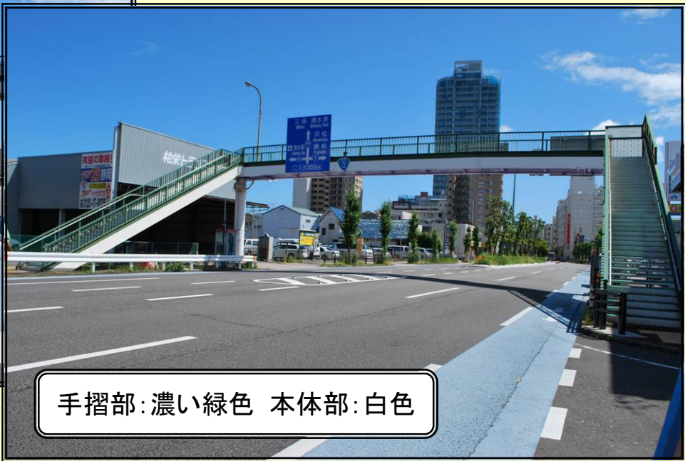
手摺部:濃い緑色 本体部:白色

周辺環境：電線の地中化が行われ、中央分離帯には植栽が施されている。 色彩コンセプト：現況の配色は、沿道環境や植栽と調和していることから 現況の配色を踏襲した配色デザインとする。