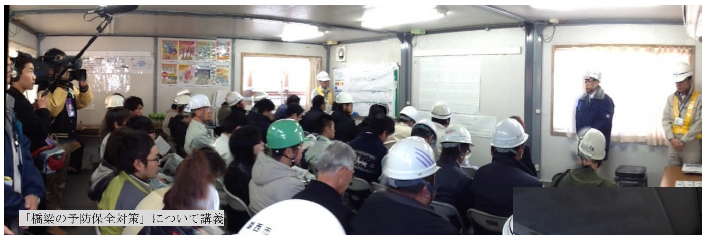
「橋梁の予防保全対策」について講義