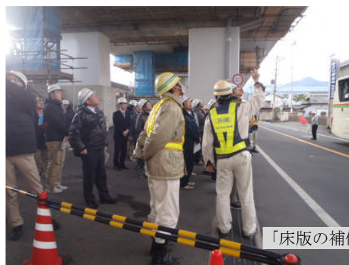
「床版の補修作業」現場見学