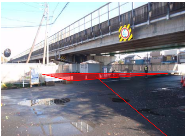
牧ヶ谷地区駐輪場 (静清国道維持出張所)