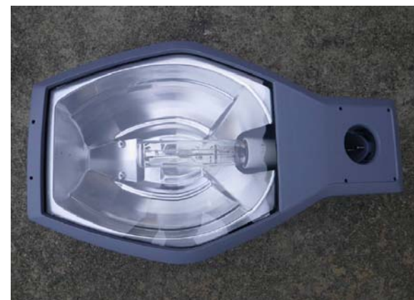
高圧ナトリウムランプ (例)

LED ; Light Emitting Diode (発光ダイオード) LED道路照明は、多数の発光ダイオード素子を照明器具内に配 置し発光する照明