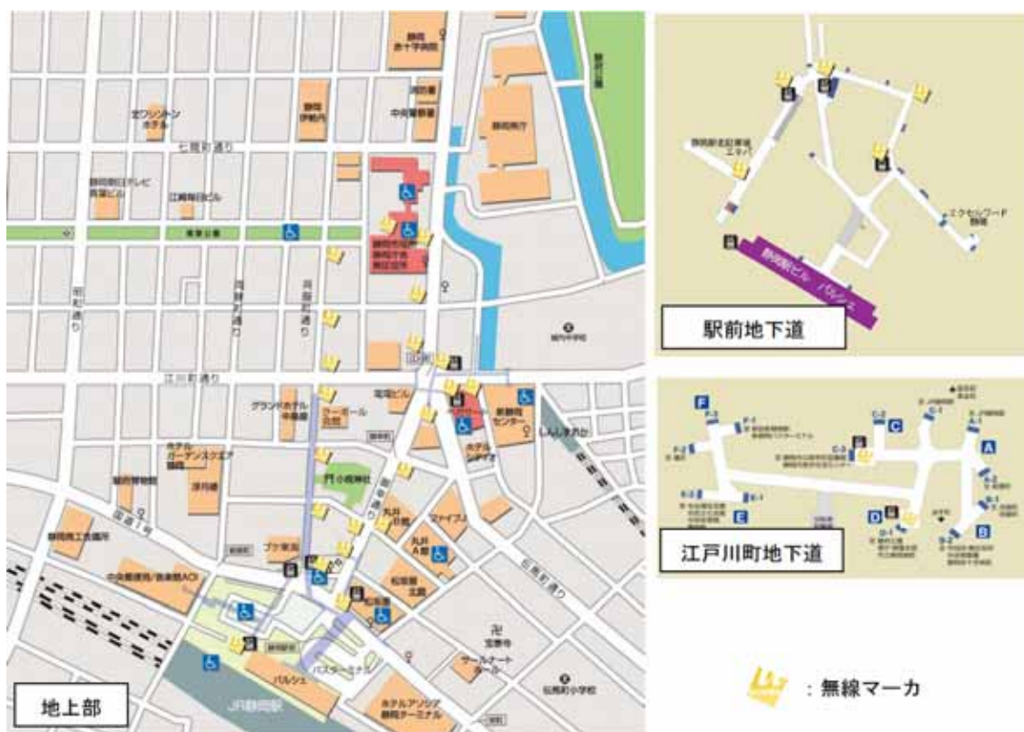
図2 無線マーカ設置位置

ナビゲーションの情報などを被験者に提供するために、無線マーカを交差点部などに設置する。本実証実験で設置する無線マーカは、図2 に示すとおり28 箇所とする。