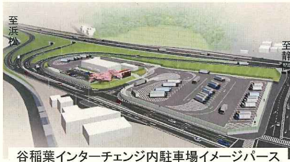
谷稲葉インターチェンジ内駐車場イメージパース

谷稲葉インターチェンジ内駐車場は、藤枝バイパスに新たに設置される休憩施設です。藤枝バイパスの前後区間には、起点側の道の駅「宇津ノ谷峠」、終点側の道の駅「掛川」がありますが、各々10km以上離れており、道路利用者が長時間休憩できない休憩時間の空白地帯となっていました。この駐車場の整備により、重大事故の抑制等、道路を利用する方の安全・安心に貢献する空間が整備されます。