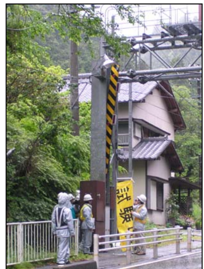
(H22通行止め装置操作訓練)