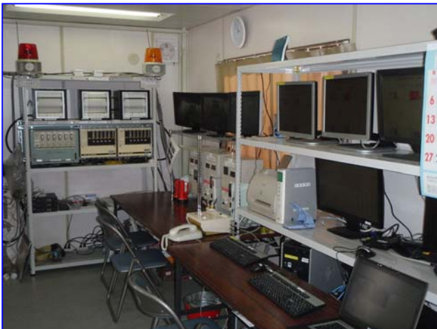
計測管理室【計測機器設置状況】