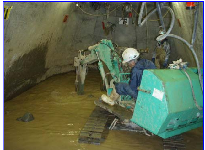
ケーソン基礎作業室内【掘削状況】