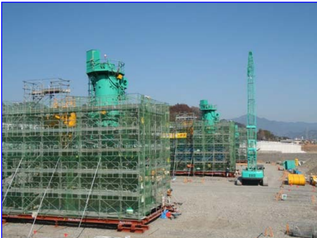
橋梁下部工【P4・P5橋脚】(右岸下流から)