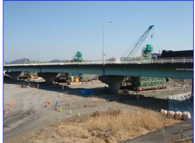
橋梁下部工【全景】(右岸上流から)