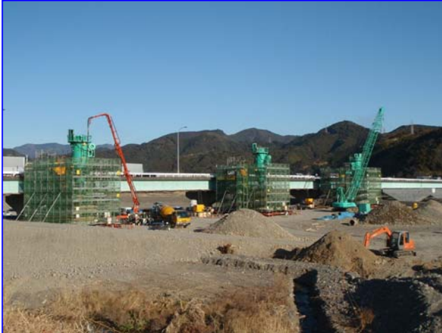
橋梁下部工【全景】(右岸下流から)