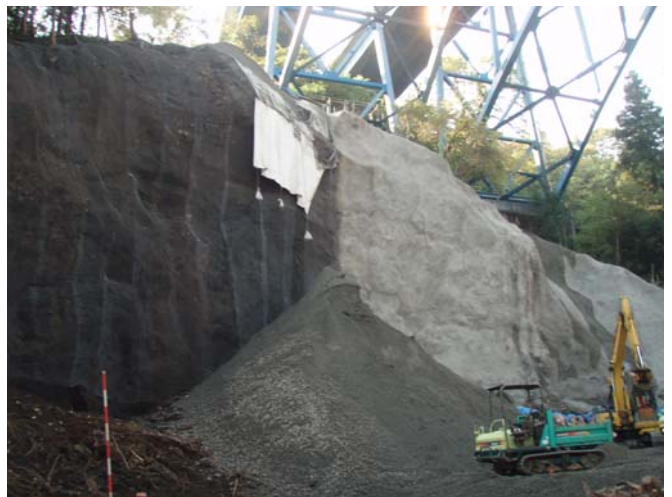
須川橋橋脚前面 浸食される恐れがある箇所の復旧状況