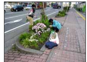
昭和町花ロードクラブ活動状況