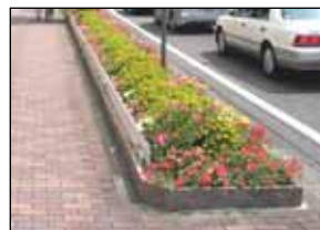
静岡市国道1号ゼロックス前

現在、当整備区間の一部植樹帯を市民団体や企業の方々が維持管理、美化活動を行っております。このため、どのような整備が望ましいか考えて行きます。