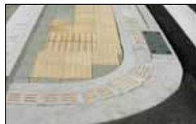
静岡市清水国道1号