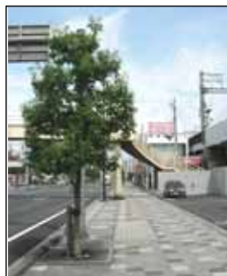
国道1号清閑町(シラカシ)

街路樹は良好な環境を創出する重要な役割を果たします。当整備区間を特徴づける、地域の皆様が望む樹種について考えて行きます。