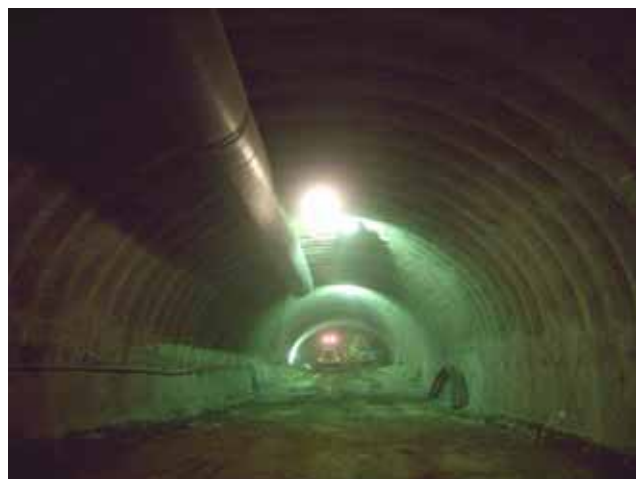
東側坑口から400m付近