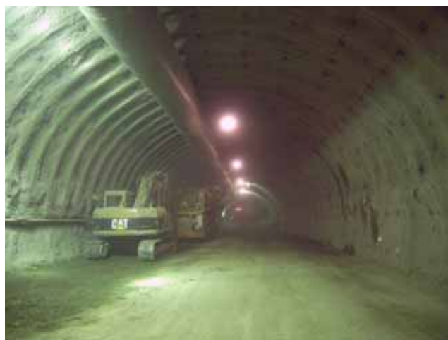
東側坑口から300m付近