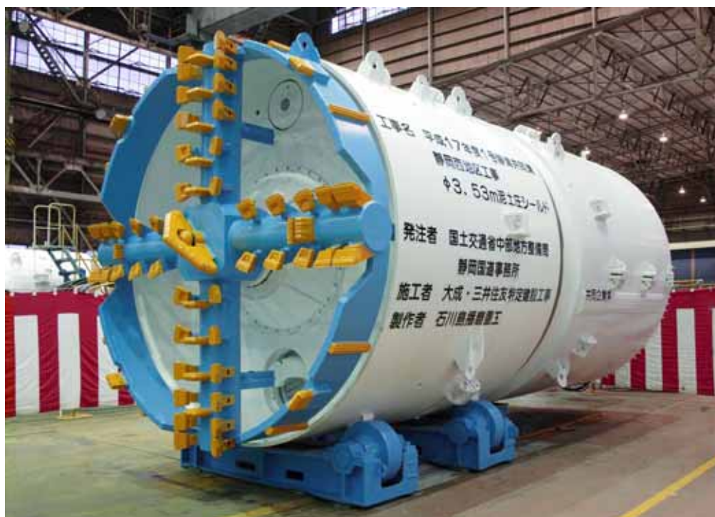
掘進機 (シールド機)