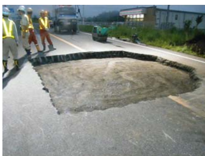
復旧作業状況(空洞の埋め戻し後)