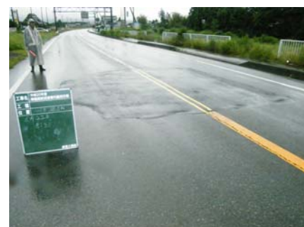
復旧作業完了後 翌日(21日)撮影