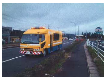
路面下空洞調査車両