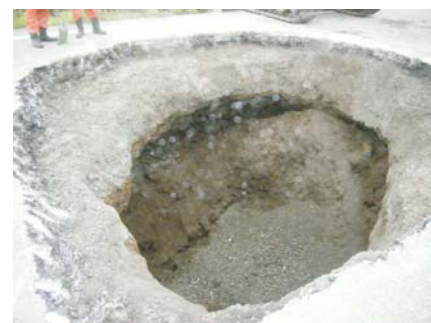
舗装下の空洞 直径約4m(舗装撤去確認)