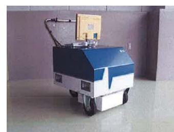
ハンディ型地下レーダ(局地的調査)