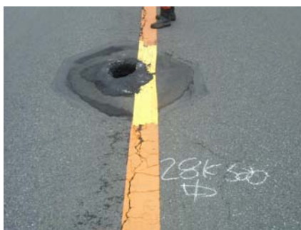
発見された際の路面陥没 直径約15cm