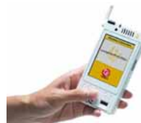
ユビキタスコミュニケーター