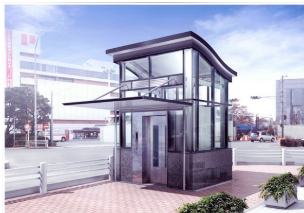
地下道昇降設備完成イメージ (エクセルワードビル前)