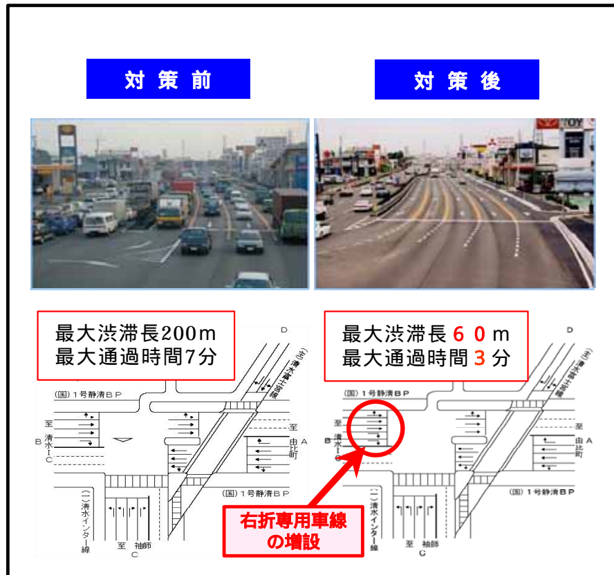
庵原・西久保交差点短期改良による渋滞の軽減