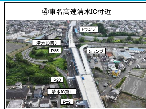
④東名高速清水IC付近

P23~P25 床版工 施工中 清水IC第3 上部工 施工中 Gランプ、Fランプ 床版工 施工中 清水IC第1 上部工 施工中