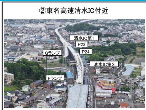
②東名高速清水IC付近