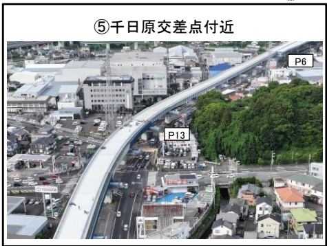
⑤千日原交差点付近