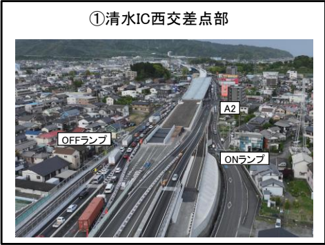
①清水IC西交差点部 A2橋台西側擁壁部 擁壁工等 施工中