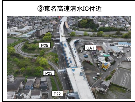
③東名高速清水IC付近 GA1~P23橋脚 床版工 施工中 P23~P25橋脚 床版工 施工中