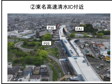
②東名高速清水IC付近 FA1~P30橋脚 床版工 施工中 P25~P30橋脚 床版工 施工完了