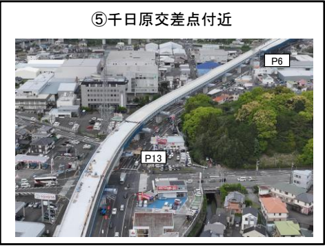
⑤千日原交差点付近