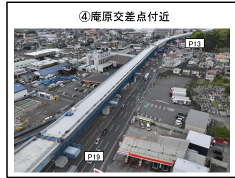
④庵原交差点付近 P13~P19橋脚 床版工 施工中